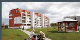
2. místo Barevné Letňany