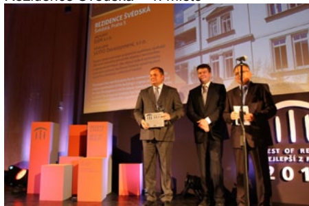
Residence Švédská – 1. místo