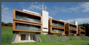
3. místo Azalea Projekt