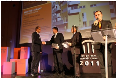
Barevné Letňany – 2. místo